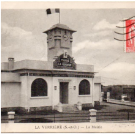
LA VERRIERE (S.-et-O.) — La Mairie