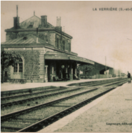
LA VERRIÈRE (S.-et-O.)