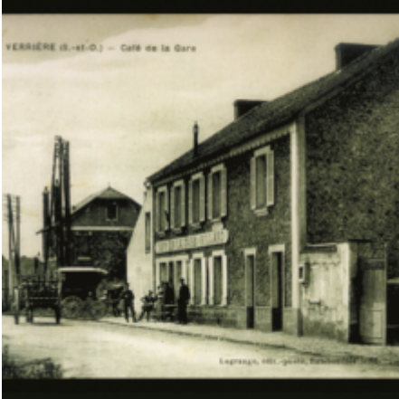
VERRIERE (S.-et-O.) — Café de la Gare