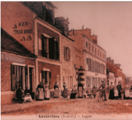
Laverrière (S.-O.) — Légiot