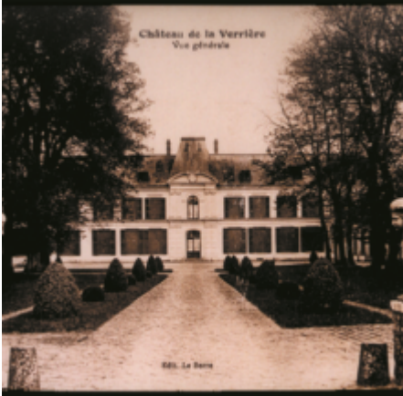
Château de la Verrière Vue générale