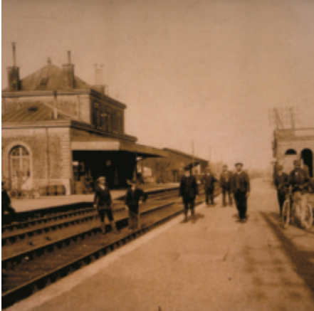
1881. Le Barre