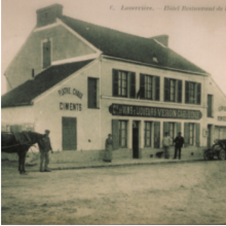
C. Laverrière. — Hôtel Restaurant de