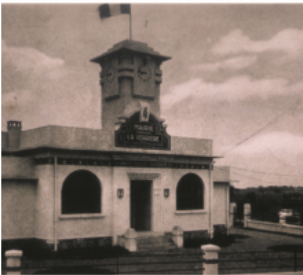
LA VERRIÈRE (S.-O.) — La Mairie