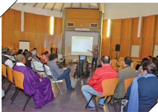
Un des nombreux ateliers sur la rénovation urbaine du Bois de l'Étang organisé cet automne.