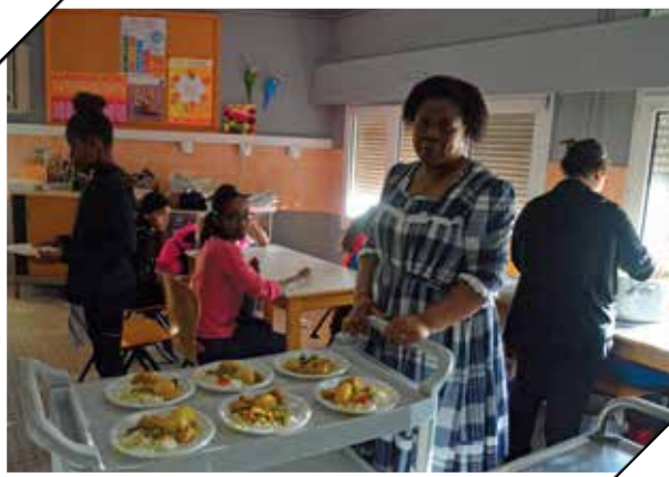
Des bénévoles préparent le repas festif du 28 décembre.