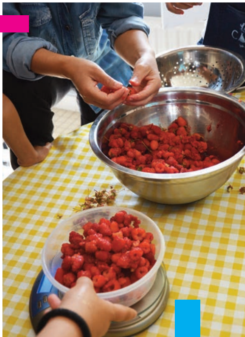
Atelier cuisine au Centre socioculturel en 2016

Gratuit (sauf barbecue) / City stade d'Orly Parc