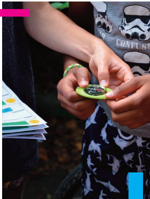
Course d'orientation en juillet 2016