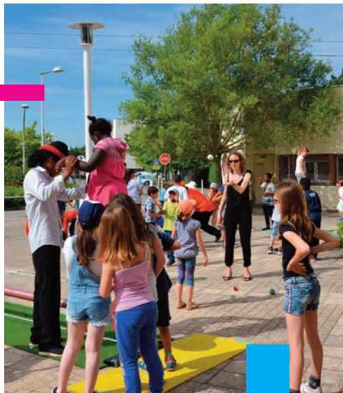
Atelier cirque l'été dernier au Bois de l'Étang